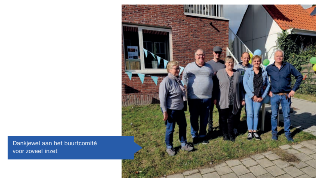
Dankjewel aan het buurtcomité voor zoveel inzet